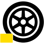
Schaden durch Bordstein